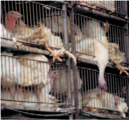
Pavos en un camión con destino al rastro.

virtualmente todo el alimento derivado de animales se obtiene a través de los crueles métodos de las granjas industrializadas. Cada año se matan cerca de 10 mil millones de animales, más de un millón cada hora, siendo el número de animales acuáticos sacrificados para el consumo humano el número más grande de todos ellos. Todos estos animales sufren enormemente por el estrés producto del hacinamiento, el ambiente que les impide seguir sus instintos básicos, amputaciones sin anestesia (incluyendo cortes de picos, de cuernos, de colas, castraciones) y otros procedimientos terriblemente dolorosos. (Bernard Rollin, Ph.D., Farm Animal Welfare).