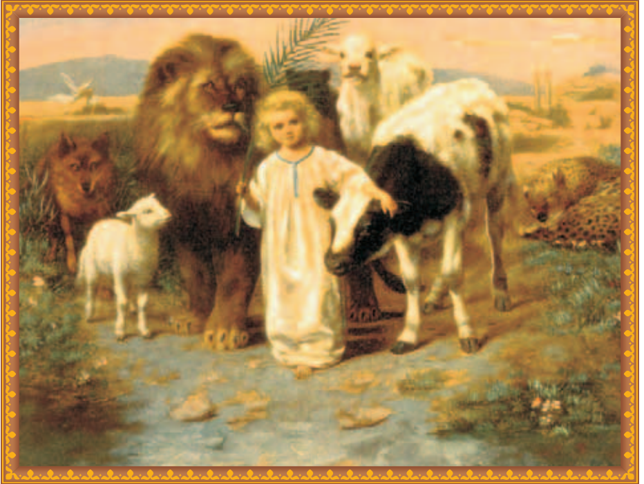
Peace por William Strutt