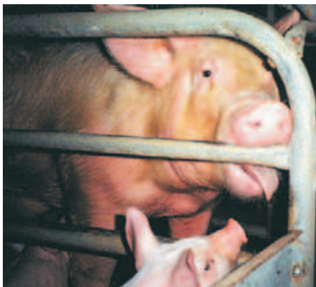
Muchas marranas para reproducción pasan toda su vida adulta en compartimientos tan pequeños que no pueden ni siquiera voltearse.

hizo un seguimiento a 77,761 mujeres durante 12 años y encontró que el consumo de leche no reduce el riesgo de fracturas de huesos.